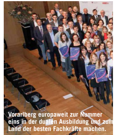
Vorarlberg europaweit zur Nummer eins in der dualen Ausbildung und zum Land der besten Fachkräfte machen.